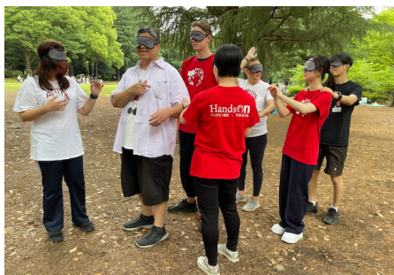
ダイバーシティ・レクリエーション