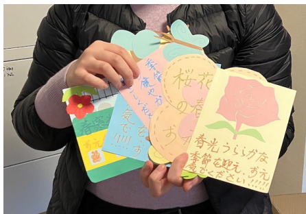
メッセージカード作り Smile to Share