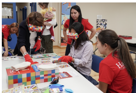
きづきのたいけん シンクボックス