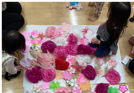
Fun with Art : さくらプロジェクト