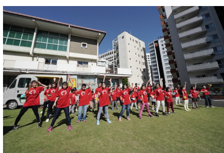
だれでもダンス! ダイバーシティディスコ