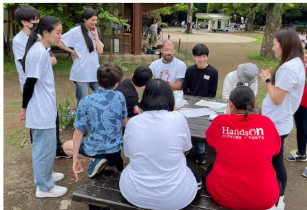
えいごであそぼう! Fun with English